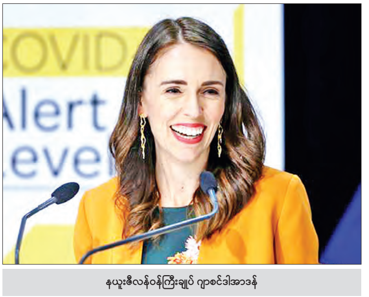
နယူးဇီလန်ဝန်ကြီးချုပ် ဂျာစင်ဒါအာဒန်

အိန္ဒိယနှင့် အမေရိကန်နိုင်ငံကဲ့သို့သော စီးပွားရေးအင်အားကြီး တိုင်းပြည်များက အဆိုပါဗိုင်းရပ်စ်ဒဏ် အလူးအလဲခံနေရသည်။ နယူးဇီလန်နိုင်ငံတွင် ဖေဖော်ဝါရီလနှောင်းပိုင်းက ပထမဆုံး အကြိမ် ကိုရိုနာဗိုင်းရပ်စ်ဖြစ်ပွားပြီးနောက်ပိုင်း ရောဂါလက္ခဏာပြသသူ ကူးစက်မှုမရှိခဲ့ဟု ကျန်းမာရေးဝန်ကြီးဌာနက ပြောကြားသည်။ ကိုဗစ်-၁၉ ရောဂါ ကူးစက်မှုမှာ ၁၁၅၄ ဦးနှင့် သေဆုံးသူ ၂၂ ဦးရှိကြောင်း နယူးဇီလန်နိုင်ငံက ထုတ်ပြန်ခဲ့သည်။ “ဖေဖော်ဝါရီ ၂၈ ရက်နောက်ပိုင်း ရောဂါလက္ခဏာပြတဲ့ ကူးစက်မှု မရှိတာ သိသာထင်ရှားတဲ့ အမှတ်သညာတစ်ခုဖြစ်ပေမယ့် ကိုဗစ်-၁၉ ရောဂါဆိုင်ရာ သတိပေးချက် မရှိမဖြစ်လိုအပ်မှာဖြစ်ပါတယ်” ဟု ကျန်းမာရေးဦးစီးဌာနမှ ညွှန်ကြားရေးမှူးချုပ် ဒေါက်တာအက်ရှ်လေ ဘလွန်းဖီးက ထုတ်ပြန်ချက်တစ်ခုအတွင်း ပြောကြားသည်။ ကိုရိုနာဗိုင်းရပ်စ်ကို ဖယ်ရှားပစ်ခြင်းမှာ အမြဲဖြစ်ပေါ်မည်ဟု မဆိုလိုသော်လည်း နောက်ဆုံးကူးစက်ခံရသည့်လူနာ သီးသန့်ခွဲနေမှု ပြီးဆုံးပြီးနောက် အတိုင်းအတာတစ်ခုအထိ ကူးစက်မှုကင်းဆက်များ ရပ်တန့်ခြင်းဖြစ်ကြောင်း ထုတ်ပြန်ချက်က ဖော်ပြသည်။ ကိုးကား-ဘီအေတီဝါ၊ ဘာသာပြန်-ကျော်ထိုက်စိုး