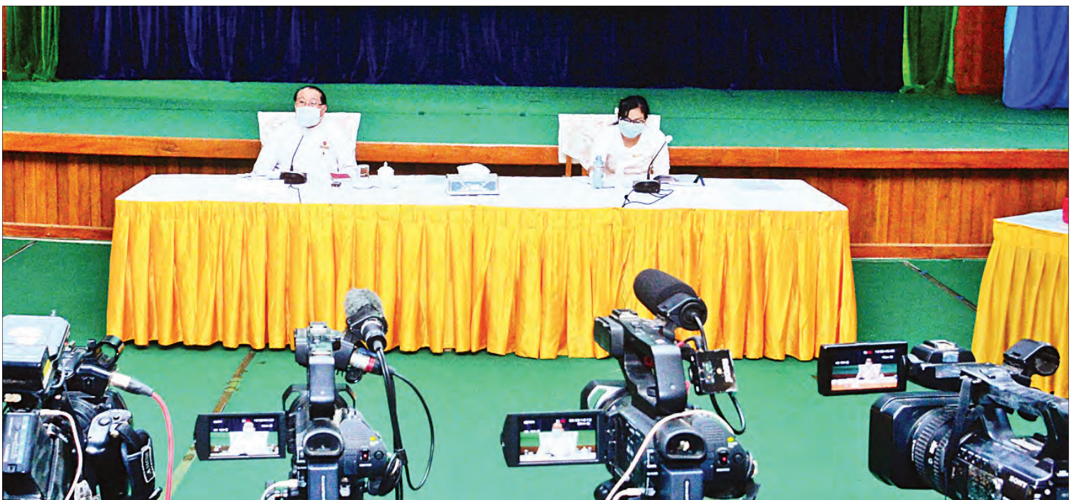
ပြည်ထောင်စုစာရင်းစစ်ချုပ်ရုံး၏ စတုတ္ထ(၁)နှစ်တာ ဆောင်ရွက်ချက်များနှင့်ပတ်သက်၍ ပြည်ထောင်စုစာရင်းစစ်ချုပ် ဦးမော်သန်း ရှင်းလင်းပြောကြားစဉ်။

လည်းကောင်း၊ Video Clip များဖြင့်လည်းကောင်း၊ မသန်စွမ်းသူများအတွက် Right to Information, Access to Information အသေအချာရရှိရန် နေပြည်တော်ကောင်စီနယ်မြေအပါအဝင် တိုင်းဒေသကြီးနှင့် ပြည်နယ်အသီးသီး၏ COVID-19 ဆိုင်ရာ နေ့စဉ်ဆောင်ရွက်နေမှုအခြေအနေများကို မသန်စွမ်းသူများ သိရှိစေရေးအတွက် မြန်မာနိုင်ငံ မသန်စွမ်းသူများအသင်းချုပ်၊ မသန်စွမ်းအဖွဲ့အစည်းများနှင့် ချိတ်ဆက်ဆောင်ရွက်ပေးခဲ့ပါကြောင်း။ မြန်မာနိုင်ငံမသန်စွမ်းသူများအသင်းချုပ်နှင့် မသန်စွမ်းအဖွဲ့အစည်း ၃၁ ဖွဲ့တို့ ဖွဲ့စည်းထားသည့် မသန်စွမ်းသူများ COVID-19 အရေးပေါ်တုံ့ပြန်ရေး ပူးပေါင်းကော်မတီက တင်ပြလာသည့် ဆင်းရဲနွမ်းပါး မသန်စွမ်းသူများနှင့် မိသားစုများ၊ စာမျက်နှာ ၃ ကော်လံ ၁ သို့