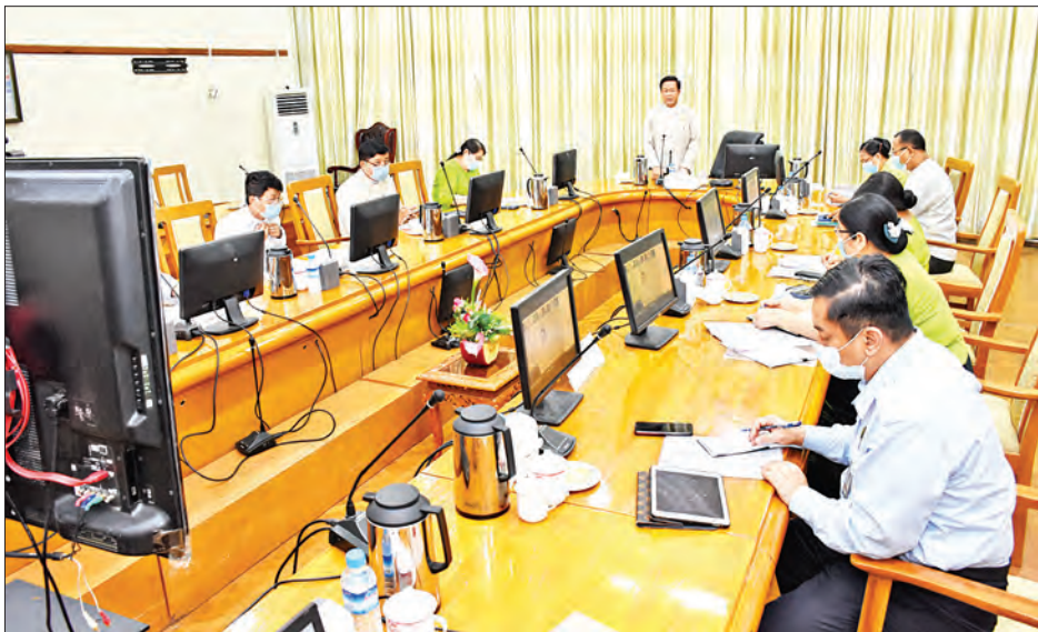
ဘဏ္ဍာရေးဝန်ကြီး၊ စပါး၊ ဆန်ဝယ်ယူရေး ကြီးကြပ်မှုလုပ်ငန်းအဖွဲ့များ၊ ဌာနဆိုင်ရာအသီးသီးမှ တာဝန်ရှိသူများနှင့် မြန်မာနိုင်ငံကုန်သည်များနှင့် စက်မှုလက်မှုလုပ်ငန်းရှင်များအသင်းချုပ်၊ မြန်မာနိုင်ငံဆန်စပါးအသင်းချုပ်၊ မွေးမြူရေး

အစည်းအဝေးသို့ ပဲခူးတိုင်းဒေသကြီး စီမံကိန်းနှင့်