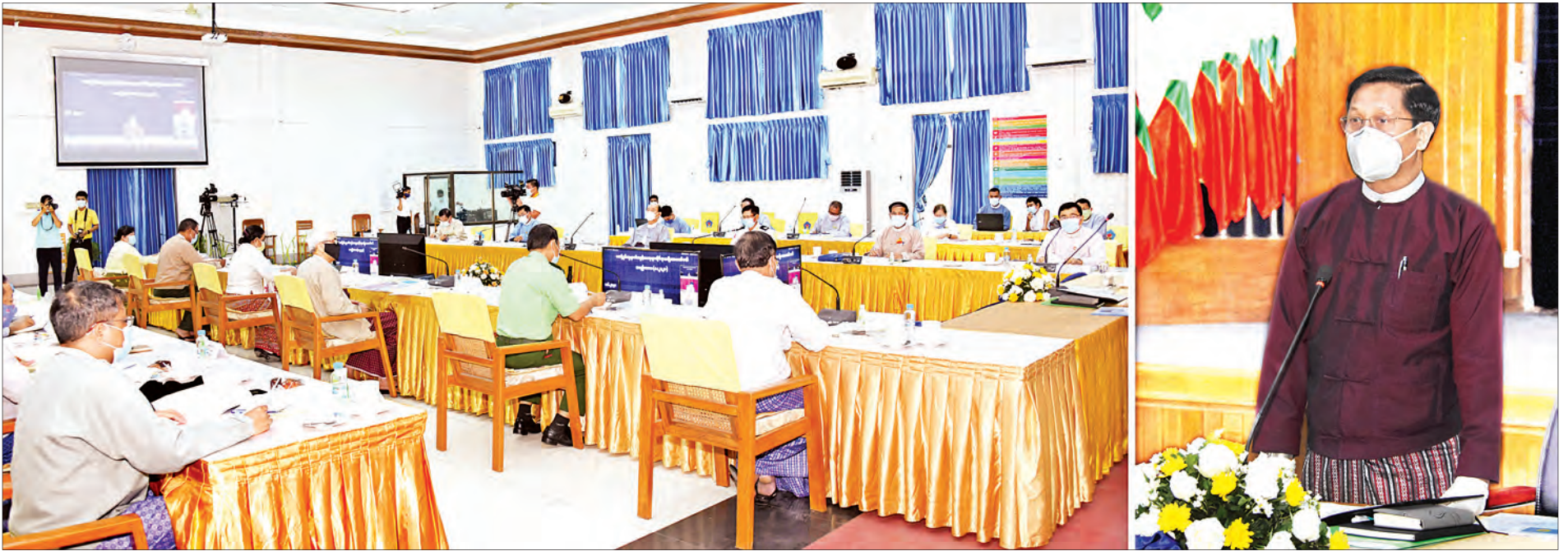
ဒုတိယသမ္မတ ဦးဟင်နရီဗန်ထီးယူ မသန်စွမ်းသူများ၏ အခွင့်အရေးများဆိုင်ရာ အမျိုးသားကော်မတီ ဆန္ဒမအကြိမ် အစည်းအဝေးတွင် အမှာစကားပြောကြားစဉ်။