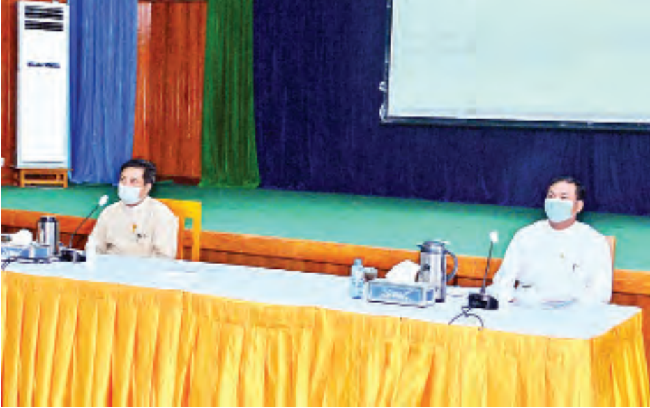
ဟိုတယ်နှင့် ခရီးသွားလာရေးဝန်ကြီးဌာန၏ စတုတ္ထ(၁)နှစ်တာကာလ ဆောင်ရွက်ခဲ့မှုများနှင့်စပ်လျဉ်း၍ ဒုတိယဝန်ကြီး ဦးတင်လတ် ရှင်းလင်းပြောကြားစဉ်။

မြန်မာနိုင်ငံ သစ်တောများ ပြန်လည်တည်ထောင်ရေး စီမံကိန်း အရ ၂၀၁၉ - ၂၀၂၀ ဘဏ္ဍာနှစ်တွင် နိုင်ငံတော်ပိုင်စိုက်ခင်း ၂၆၀၉၃ ဧက တည်ထောင်နိုင်ခဲ့ပါကြောင်း၊ မြန်မာ နိုင်ငံ သစ်တောများ ပြန်လည် တည်ထောင်ရေး စီမံကိန်းတွင် သစ်တောစိုက်ခင်းများ တည်ထောင် ခြင်းလုပ်ငန်းအပါအဝင် သစ်တော ပြုစုထိန်းသိမ်းခြင်း လုပ်ငန်းများကို စီမံကိန်းဇုန် ခြောက်ခုခွဲခြား၍ ၂၀၁၇- ၂၀၁၈ ခုနှစ်မှ စတင်၍ အကောင် အထည်ဖော် ဆောင်ရွက်လျက်ရှိပါ ကြောင်း၊ သစ်ထုတ်လုပ်ရာတွင် နှစ်စဉ် တောထွက် ပမာဏထက် လျော့နည်း ထုတ်လုပ်ခြင်းအနေဖြင့် သဘာဝ တောမှ နှစ်စဉ်တောထွက်ပမာဏ (Annual Allowable Cut - AAC) ၏ ကျွန်း ၁၇ ရာခိုင်နှုန်းနှင့် သစ်မာ ၂၁ ဒသမ ၉ ရာခိုင်နှုန်းသာ ထုတ်လုပ် လျက်ရှိပါကြောင်း၊ သစ်ထုတ်လုပ် ရေးတွင် AAC လျာထားချက်များထက် လျော့ချထုတ်လုပ်လျက်ရှိပါကြောင်း။