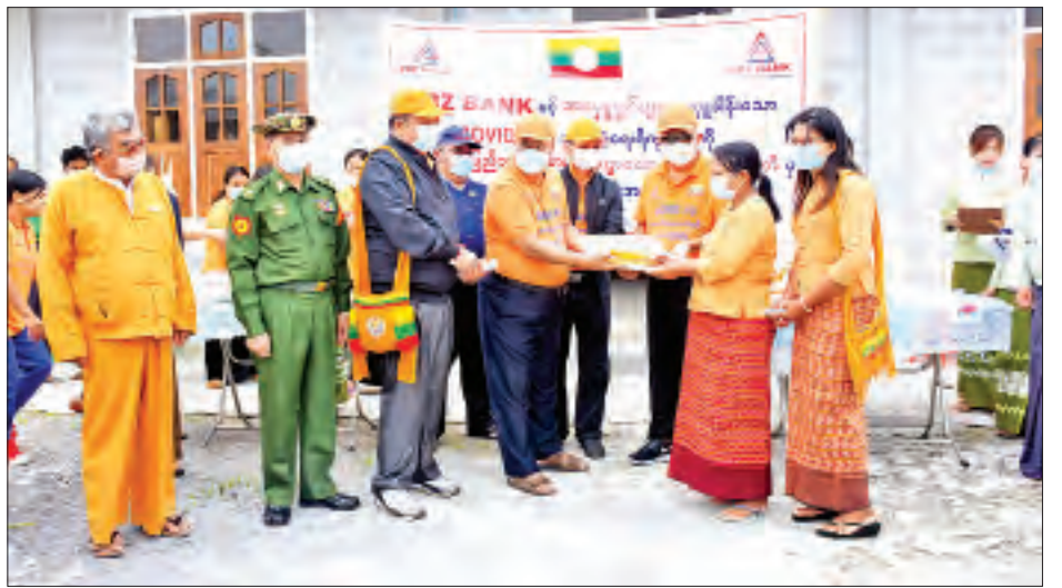
ကျောက်နီတောရစာသင်တိုက်သို့ သွားရောက်၍ လှူဖွယ်ဝတ္ထုပစ္စည်းများ ဆက်ကပ်လှူဒါန်းခဲ့ကြကြောင်း ဆရာတော်အား ဖူးမြော် ကြည်ညိုကာ ဆန်၊ ဆီနှင့် သိရသည်။ ပြည်နယ်(ပြန်/ဆက်)