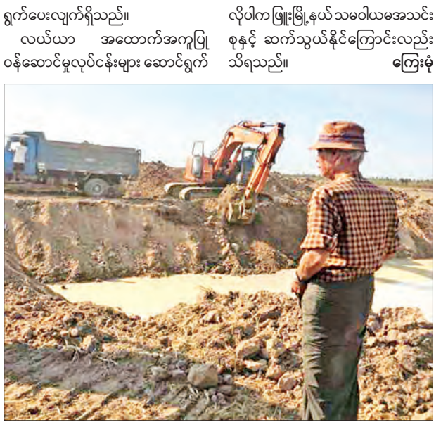
ရွက်ပေးလျက်ရှိသည်။ လယ်ယာ အထောက်အကူပြု စုနှင့် ဆက်သွယ်နိုင်ကြောင်းလည်း သိရသည်။ ကြေးမုံ

ဖြူး ဇွန် ၁၇ ပဲခူးတိုင်းဒေသကြီး ဖြူးမြို့နယ်အတွင်းရှိ သီးနှံစိုက်ပျိုးထုတ်လုပ်သည့် သမဝါယမအသင်းသား တောင်သူများ လုပ်ငန်းခွင်တွင် အဆင်ပြေစေရေးအတွက် မြေယာပြုပြင်ထွန်းဖွတ်ခြင်း၊ ရိတ်သိမ်းခြင်းလုပ်ငန်းများကို ဖြူးမြို့နယ် သမဝါယမအသင်းစုမှ လယ်ယာ အထောက်အကူပြု ဝန်ဆောင်မှုလုပ်ငန်းများကို လုပ်ငန်းခွဲတစ်ရပ်အနေဖြင့် ဆောင်ရွက်ပေးလျက်ရှိသည်။ ဖြူးမြို့နယ် သမဝါယမအသင်းစုအနေဖြင့် 90 HP ထွန်စက်ကြီး လေးစီး၊ ဘက်ဟိုး တစ်စီး၊ 70 HP ကူဘိုတာ ရိတ်သိမ်းခြွေလှေ့စက် ငါးစီးဖြင့် လယ်ယာအထောက်အကူပြု ဝန်ဆောင်မှုလုပ်ငန်းများကို ကူညီဆောင်