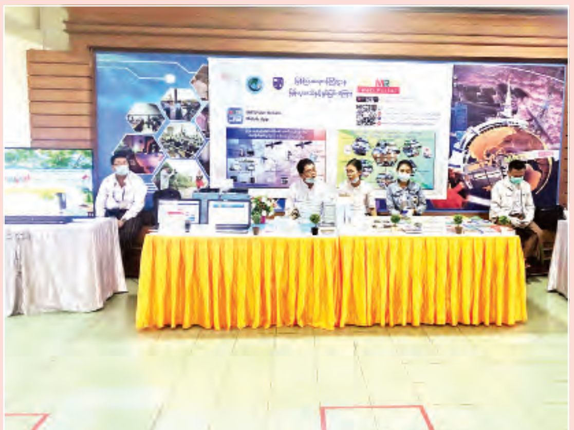
မြန်မာ့အသံနှင့် ရုပ်မြင်သံကြားက ခင်းကျင်းပြသထားမှုကို တွေ့ရစဉ်။