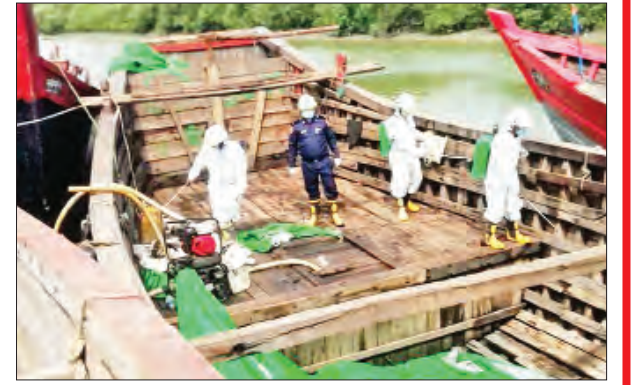
ရခိုင်ပြည်နယ် မောင်တောမြို့ အမှတ်(၁) နယ်စပ် အဝင်/အထွက် စခန်း၌ ၉ ဇူလိုင် ၁၂ ရက်က ကိုဗစ်-၁၉ ရောဂါ ကာကွယ်ရေး ပိုးသတ်ဆေးဖျန်းစဉ်။