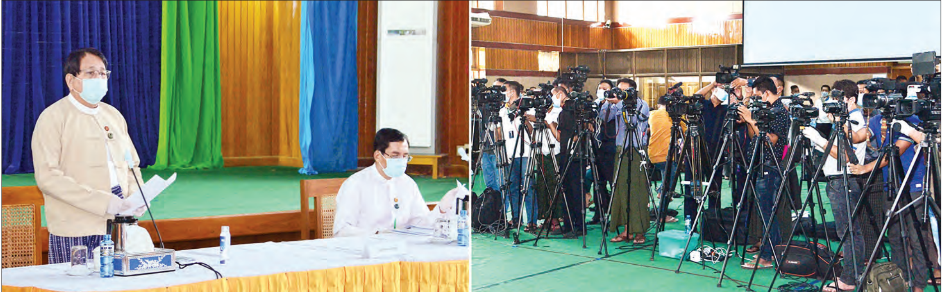
ပြန်ကြားရေးဝန်ကြီးဌာန၏ စတုတ္ထ(၁)နှစ်တာကာလ ဆောင်ရွက်ခဲ့မှုများနှင့်စပ်လျဉ်း၍ ပြည်ထောင်စုဝန်ကြီး ဒေါက်တာဖေမြင့် ရှင်းလင်းပြောကြားစဉ်။