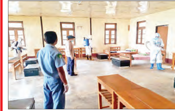
ချင်းပြည်နယ် ဖလမ်းမြို့၌ ၉ ဇူလိုင် ၁၁ ရက်က ကိုဗစ်-၁၉ ရောဂါ ကာကွယ်ရေး ပိုးသတ်ဆေးဖျန်းစဉ်။

စစ်ကိုင်းတိုင်းဒေသကြီး ကလေးမြို့ ကန့်သတ်စောင့်ကြည့်စခန်းထားရှိသည့် အခြေခံ ပညာအထက်တန်းကျောင်း၌ ၉ ဇူလိုင် ၁၁ ရက်က ကိုဗစ်-၁၉ ရောဂါ ကာကွယ်ရေး ပိုးသတ်ဆေး ဖျန်းစဉ်။