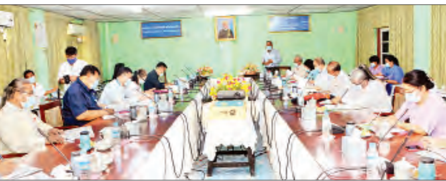
မြန်မာ့ရုပ်ရှင်ရာပြည့်အခမ်းအနား အောင်မြင်စွာကျင်းပနိုင်ရေး ပြိုင်ပွဲများကျင်းပရေးဆက်ဆံရေးကော်မတီ၏ စတုတ္ထအကြိမ် လုပ်ငန်းညှိနှိုင်းအစည်းအဝေး ကျင်းပစဉ်။

ရန်ကုန် ဇွန် ၁၇ မြန်မာ့ရုပ်ရှင် ရာပြည့်အခမ်းအနား အောင်မြင်စွာ ကျင်းပနိုင်ရေးအတွက် ပြခန်းများ ခင်းကျင်းပြသရေး ဆက်ဆံရေးနှင့် ပြိုင်ပွဲများ ကျင်းပရေးဆက်ဆံရေးအစည်းအဝေးများကို ယနေ့ မွန်းလွဲပိုင်းက ရန်ကုန်မြို့ ဗဟန်းမြို့နယ်ရှိ ပြန်ကြားရေးနှင့် ပြည်သူ့ဆက်ဆံရေးဦးစီးဌာန ရုပ်ရှင် မြှင့်တင်ရေးဌာနခွဲ အစည်းအဝေး ခန်းမ၌ ကျင်းပသည်။ ပြခန်းများ ခင်းကျင်းပြသရေး ဆက်ဆံရေးအစည်းအဝေးတွင် မြန်မာနိုင်ငံရုပ်ရှင် အစည်းအရုံးနာယကများနှင့် တက်ရောက်လာကြသူများက ယခင်မြန်မာ့ ရုပ်ရှင်၊ ငွေရတု၊ ရွှေရတုနှင့် စိန်ရတု ခေတ်အဆက်ဆက်တွင် ကျင်းပခဲ့သည့် အတွေ့အကြုံများ၊ အမှတ်တရ ပစ္စည်းများ ထုတ်လုပ်ရောင်းချရေး အစီအစဉ်များ၊ အလှပြယာဉ်များဖြင့် ဖျော်ဖြေရေးအစီအစဉ်များ၊ ထင်ရှားကျော်ကြားသည့် ပုဂ္ဂိုလ်များကို 3D ပန်းချီကားများဖြင့် ရေးဆွဲဖော်ပြမည့် အစီအစဉ်များ၊ စားသောက်ဆိုင်များ တည်ခင်းရောင်းချရေး အစီအစဉ်များ၊ စာနယ်ဇင်းများကပြောသော ရုပ်ရှင် ရာပြည့် အစီအစဉ်၊ စတန့်ပြခန်းများ ပြသထားရှိရေး၊ ပြခန်းများ တာဝန်ခွဲဝေမှု ကိစ္စများ၊ အနုပညာဖန်တီးသူ လူငယ်များ၏ဇာတ်လမ်းရုပ်ရှင်တိုများ ပြသနိုင်ရေးအစီအစဉ်၊ အနုပညာ ချစ်မြတ်နိုးသူများနှင့် အနုပညာရှင်များ အမှတ်တရ ဓာတ်ပုံတိုရိုက်ရေး အစီအစဉ်များ၊ နိုင်ငံတကာမှအနုပညာ ရှင်များနှင့် ပူးပေါင်းဆောင်ရွက်မည့် အစီအစဉ်များနှင့်စပ်လျဉ်း၍ ဆွေးနွေးကြသည်။