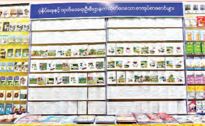
ပုံနှိပ်ရေးနှင့် ထုတ်ဝေရေးဦးစီးဌာနက ထုတ်ဝေခဲ့သည့် စာအုပ်စာစောင်များ။