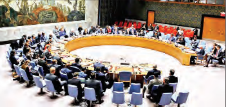
၂၀၁၉ ခုနှစ် ဇွန်လက ကုလသမဂ္ဂလုံခြုံရေးကောင်စီအစည်းအဝေး ကျင်းပစဉ်။