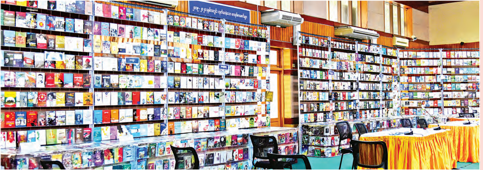
၂၀၁၉ ခုနှစ်နှင့် ၂၀၂၀ ပြည့်နှစ်အတွင်း ထုတ်ဝေခဲ့သည့် စာအုပ်စာစောင်များ။