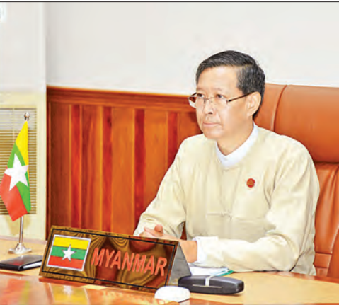
မူဝါဒရေးရာဆွေးနွေးဆွေးနွေးပွဲတွင် ဆရာအတတ်ပညာရေးသင်ရိုး ပြုစုမှု အကောင်အထည်ဖော်ဆောင်ရွက်မှု၊ ဆရာအတတ်

သင် သင်တန်း ဆရာ ဆရာမများအား သင်တန်းများပေးနေမှု၊ ကိုဗစ်-၁၉ ကာလအတွင်း ဆရာအတတ်ပညာ သင်တန်းသား၊ သင်တန်းသူများ ဆက်လက်ပညာသင်ယူနိုင်ရေးနှင့် ဆရာတတ်ကျွမ်းမှု စံသတ်မှတ်ချက် အညွှန်းဘောင်၊ ဆရာများ မူဝါဒရေးရာများအကြောင်း ဆွေးနွေးခဲ့ကြသည်။ မြန်မာနိုင်ငံလုပ်ငန်းခွင်အကြို ဆရာအတတ်ပညာအရည်အသွေးတိုးမြှင့်ရေးစီမံကိန်းကို ဩစတြေးလျနိုင်ငံအစိုးရ ဖင်လန်နိုင်ငံအစိုးရနှင့် ယူနက်စကိုတို့က ပူးပေါင်းဆောင်ရွက်နေခြင်းဖြစ်ပြီး ဇူလိုင်လတွင် အကောင်အထည်ဖော်ဆောင်ရွက်မည့် မြန်မာနိုင်ငံလုပ်ငန်းခွင်အကြို ဆရာအတတ်ပညာ အရည်အသွေးတိုးမြှင့်ရေးစီမံကိန်း (STEM) အဆင့် (၃)အတွက် ဖင်လန်နိုင်ငံအစိုးရက ယူရိုငါးသန်း ကူညီပံ့ပိုးပေးကြောင်း သိရသည်။ သတင်းစဉ်