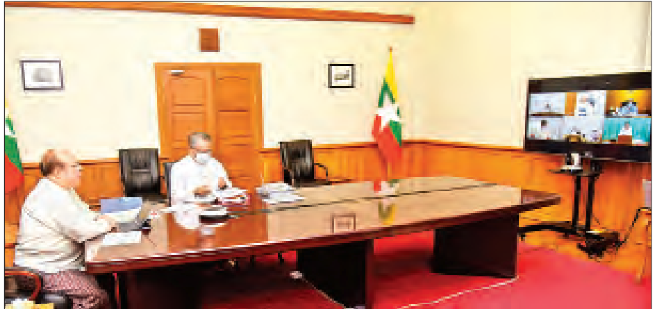
ဒုတိယအကြိမ် ကိုဗစ်-၁၉ ရန်ပုံငွေ ထပ်မံလျာထားရာတွင် ချေးငွေထုတ်ပေးမည့် လုပ်ငန်းကဏ္ဍများ သတ်မှတ်ရေး၊ ချေးငွေရယူထားသည့် လုပ်ငန်းများက ချေးငွေအသုံးပြုမှု အပေါ် စိစစ်ကြပ်မတ်ဆောင်ရွက်မည့် လုပ်ငန်းစဉ်များနှင့်

ဆက်လက်၍ တက်ရောက်လာကြသူများက လုပ်ငန်း ကော်မတီက ဆောင်ရွက်ခဲ့သည့် လုပ်ငန်းစဉ်များအပေါ် ပြန်လည်သုံးသပ်ညှိနှိုင်းကြပြီး UMFC နှင့် MICPA တို့မှ ဒုတိယအကြိမ် ထပ်မံစိစစ်ထောက်ခံသည့် လုပ်ငန်းများသို့ သတ္တမအကြိမ်မြောက် ချေးငွေအဖြစ် ထုတ်ပေးနိုင်ရေး၊