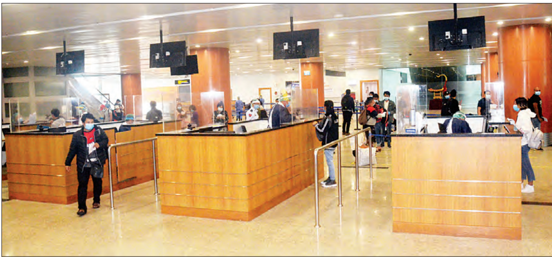
မလေးရှားနိုင်ငံမှ ပြန်လည်ရောက်ရှိလာသည့် မြန်မာနိုင်ငံသားများအား ရန်ကုန်အပြည်ပြည်ဆိုင်ရာလေဆိပ်၌ တွေ့ရစဉ်။