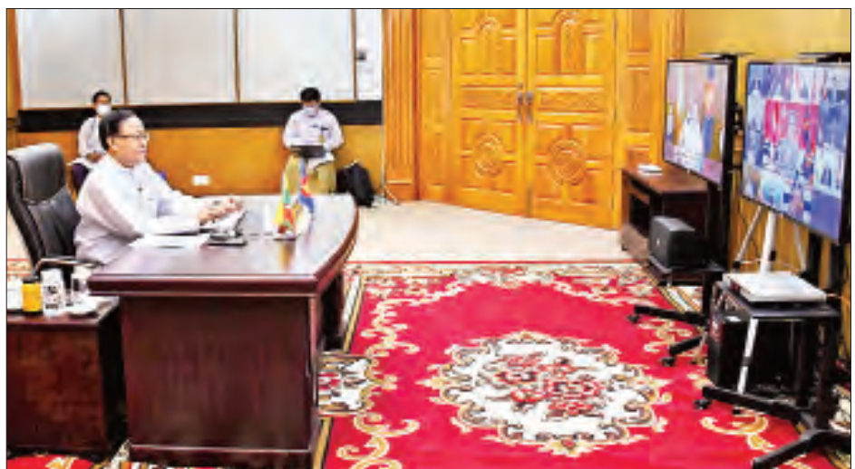
စောစီးစွာဆောင်ရွက်ခဲ့ ပြည်ထောင်စုဝန်ကြီး ဦးကျော်တင်က ကိုဗစ်-၁၉ ကြောင့် ဖြစ်ပေါ်လာသည့် ကျန်းမာရေးနှင့် လူမှု-စီးပွားရေး ထိခိုက်နစ်နာမှုများကို ဖြေရှင်းရာတွင် မြန်မာအစိုးရ အနေဖြင့် အရင်းအမြစ်အကန့်အသတ်ရှိသော်လည်း “တစ်နိုင်ငံလုံးပါဝင်သည့် ချဉ်းကပ်မှုပုံစံ” ဖြင့် စောစီးစွာ အရေးယူ ဆောင်ရွက်ခဲ့ကြောင်း ကိုဗစ်-၁၉ ရောဂါကို ကာကွယ်ထိန်းချုပ်ထားနိုင်သည့် အခြေအနေများနှင့် ကူးစက်ရောဂါတိုက်ဖျက်ရာတွင် အစိုးရအနေဖြင့် ပြည်သူ များ၏ပူးပေါင်းပါဝင်မှုကို ရယူလျက် “မည်သူတစ်ဦး တစ်ယောက်မျှ မကျန်ရစ်စေရေး”ကို ကျင့်သုံး၍ ကူးစက်

အစည်းအဝေးတွင် ဝန်ကြီးများက ပြည်သူ့ကျန်းမာ ရေးဆိုင်ရာ အရေးပေါ်အခြေအနေများတုံ့ပြန်ရေးနှင့် ကူးစက်ရောဂါအလွန် ပြန့်လွှတ်ထူထောင်ရေးတို့တွင် အာဆီယံ-ရုရှား ပူးပေါင်းဆောင်ရွက်မှု ပိုမိုတိုးမြှင့်ရေး၊ ကိုဗစ်-၁၉ ကူးစက်ရောဂါ တိုက်ဖျက်ရာတွင် အာဆီယံက ဦးဆောင်သည့် ယန္တရားများ၏အခန်းကဏ္ဍ ပိုမိုတိုးတက် ခိုင်မာစေရေး၊ နိုင်ငံတကာဥပဒေများကို လေးစားလိုက်နာပြီး ကိုဗစ်-၁၉ ကူးစက်ရောဂါအလွန်ကာလတွင် အရှုပ်ထွေးစွာ ဒေသ၏ ဒေသတွင်းဆွေးနွေးမှုယန္တရား တည်ဆောက်မှုနှင့် အာဆီယံ၏ အရေးပါပတ်ကူမှုတို့ကို တိုးမြှင့်ဖော်ဆောင်ရေး စသည့်ကိစ္စရပ်များအပေါ် ဆွေးနွေးအမြင်ချင်းဖလှယ်ခဲ့ကြ သည်။