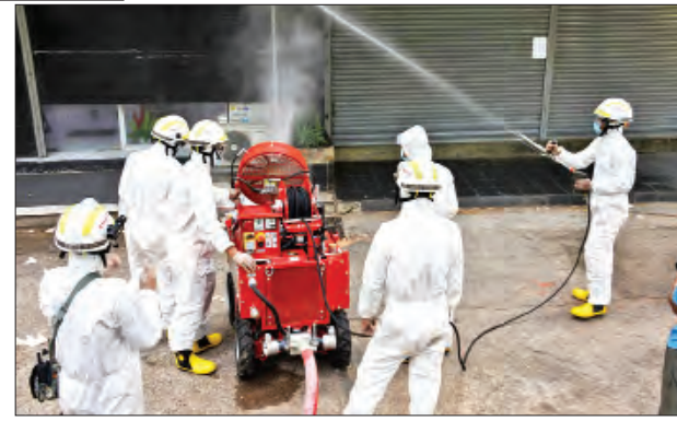
ရန်ကုန်မြို့ စမ်းချောင်းမြို့နယ်၌ ၉ ဇူလိုင် ၁၂ ရက်က ကိုဗစ်-၁၉ ရောဂါ ကာကွယ်ရေး ပိုးသတ်ဆေးဖျန်းစဉ်။