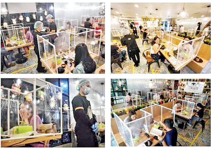
စားသောက်ဆိုင်များတွင် Physical Distancing နမူနာပုံစံများ

ကျန်းမာရေးနှင့်အားကစားဝန်ကြီးဌာန ၁၁-၆-၂၀၂၀