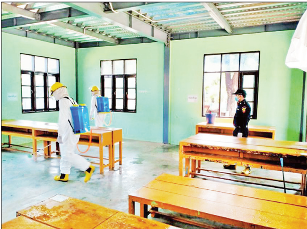
နေပြည်တော် ဇေယျာသီရိမြို့နယ် ကျောက်ချက်အခြေခံပညာအထက်တန်းကျောင်း၌ ကိုဗစ်-၁၉ ရောဂါ ကာကွယ်ရေး ပိုးသတ်ဆေးဖျန်းစဉ်။