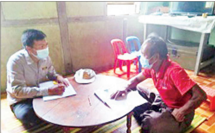
ကျေးရွာရန်ပုံငွေကြီးကြပ်မှု ကော်မတီဝင်တစ်ဦးက အသင်းသားတစ်ဦးအား အိမ်တိုင် ရာရောက် ငွေထုတ်ချေးပေးစဉ်။

ဝယ်လို့မရဖြစ်နေတာပါ။ စိုက်ပျိုးထားတဲ့ သီးနှံတွေက ရောင်းမထွက်တော့ ဝင်ငွေမရှိ တာနဲ့ အခက်အခဲကြုံနေပါတယ်။ အဲဒါ ကျေးလက်ဦးစီးဌာနက မြစ်မီးရောင်ချေးငွေကို ပြား ၅၀ အတိုးနှုန်းနဲ့ ငွေကျပ် ၁၅ သိန်း ချေးပေးတဲ့အတွက် လုပ်ငန်းပြန်လည် လည်ပတ်နိုင်ပါတယ်။ အခက်အခဲကြုံနေတဲ့ အချိန်မှာ အတိုးနှုန်းသက်သာစွာနဲ့ ငွေထုတ် ချေးပေးတဲ့အတွက် ကျေးလက်ဒေသဖွံ့ဖြိုး တိုးတက်ရေးဦးစီးဌာနကို တကယ်ပဲကျေးဇူး တင်ပါတယ်။”