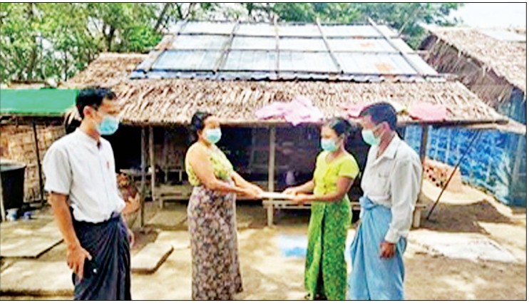
ကျေးရွာရန်ပုံငွေကြီးကြပ်မှု ကော်မတီဝင်များက ကျေးရွာသူ ကျေးရွာသားများအား အိမ်တိုင်ရာရောက် ငွေထုတ်ချေးပေးစဉ်။

ကိုဗစ်-၁၉ ရောဂါ ဖြစ်ပွားနေသည့် အချိန်တွင် အလုပ်အကိုင်အခွင့်အလမ်းများ ရပ်နားထားပြီး ရောင်းဝယ်ဖောက်ကားမှု နှောင့်နှေးခြင်း၊ ဝင်ငွေလျော့နည်းပြီး ဝင်ငွေနှင့်ထွက်ငွေ မမျှတခြင်းတို့ကြောင့် ကျေးရွာနေပြည်သူများအား ဝင်ငွေနည်း နေချိန်တွင် ထွက်ငွေဘက်မှ တစ်ဖက် တစ်လမ်းမှ သက်သာသွားစေဖို့ ကူညီ ထောက်ပံ့ပေးရန် မြစ်မီးရောင်ကျေးရွာ စီမံကိန်းဆောင်ရွက်နေသည့် ကျေးရွာများ တွင် ချေးငွေအတွက် ငွေကျပ် ၁၀၀ တွင် တစ်လလျှင် အတိုးနှုန်းကို ပြား ၅၀ ဖြင့် တစ်ပြေးညီ သတ်မှတ်ပေးခဲ့ပါသည်။ လက်ရှိ သတ်မှတ်သည့် အတိုးနှုန်းကို တစ်နှစ်တိတိ လျှော့ပေါ့ပေးခြင်း ဖြစ်ပါသည်။