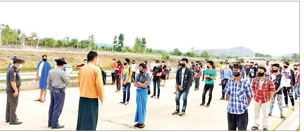
ဝင်ရောက်ခဲ့ပြီးဖြစ်သည်။ ယနေ့ ပြန်လည်ဝင်ရောက်သူများအနေဖြင့် တိုင်းဒေသကြီး၊ ပြည်နယ် အသီးသီးမှ အမျိုးသား ၄၂၅ ဦး၊ အမျိုးသမီး ၂၄၅ ဦး စုစုပေါင်း ၆၇၀ ဖြစ်ကြောင်း ထိန်းလင်းအောင်(ပြန်/ဆက်)