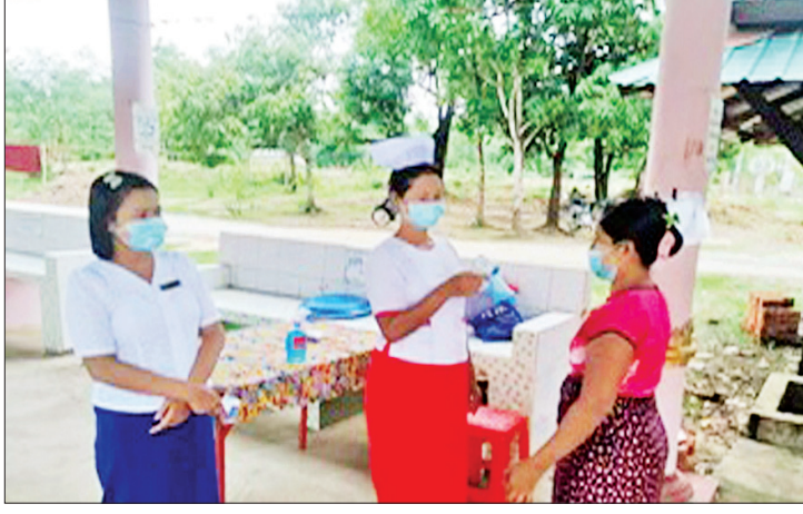
ကျန်းမာရေးနှင့်အားကစားဝန်ကြီးဌာနမှ ညွှန်ကြားချက်များနှင့်အညီ ကျန်းမာရေးဝန်ထမ်း များက ငွေထုတ်ချေးယူမည့် ကျေးရွာသူ ကျေးရွာသားများအား အပူချိန်တိုင်းပေးစဉ်။

ကိုဗစ်-၁၉ ရောဂါဖြစ်ပွားနေသည့်အချိန်တွင် အလုပ်အကိုင်အခွင့်အလမ်းများ ရပ်နားထားပြီး ရောင်းဝယ် ဖောက်ကားမှု နှောင့်နှေးခြင်း၊ ဝင်ငွေလျော့နည်းပြီး ဝင်ငွေနှင့်ထွက်ငွေ မမျှခြင်းတို့ကြောင့် ကျေးရွာနေပြည်သူများအား ဝင်ငွေနည်းနေချိန်တွင် ထွက်ငွေဘက်မှ တစ်ဖက်တစ်လမ်းမှ သက်သာ သွားစေဖို့ ကူညီထောက်ပံ့ပေးရန် မြစ်မီးရောင်ကျေးရွာ စီမံကိန်းဆောင်ရွက်နေသည့် ကျေးရွာများတွင် ချေးငွေအတွက် ငွေကျပ် ၁၀၀ တွင် တစ်လလျှင် အတိုးနှုန်းကို ပြား ၅၀ ဖြင့် တစ်ပြေးညီ သတ်မှတ် ပေးခဲ့ပါသည်။ လက်ရှိသတ်မှတ်သည့် အတိုးနှုန်းကို တစ်နှစ်တိတိ လျှော့ပေါ့ပေးခြင်းဖြစ်ပါသည်။