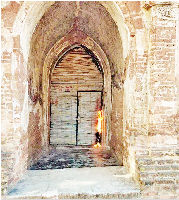
လောကထိပ်ပန်ဘုရား ပါးယင်းလိပ် မီးလောင်ထားမှုအား တွေ့ရစဉ်။

ယခုကာလ၌ ဝန်ထမ်းအင်အား အပြင် ပုဂံညောင်ဦး ဧည့်လမ်းညွှန်