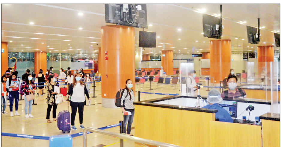
စင်ကာပူနိုင်ငံမှ ပြန်လည်ရောက်ရှိလာသော မြန်မာနိုင်ငံသားများအား ရန်ကုန်အပြည်ပြည်ဆိုင်ရာလေဆိပ်၌ တွေ့ရစဉ်။

ရန်ကုန်အပြည်ပြည်ဆိုင်ရာလေဆိပ်သို့ အဆင်ပြေချောမွေ့စွာ ပြန်လည်ရောက်ရှိကြသည်။ ၎င်းတို့ ရန်ကုန်အပြည်ပြည်ဆိုင်ရာလေဆိပ်သို့ ရောက်ရှိချိန်တွင် လူဝင်မှုကြီးကြပ်ရေး၊ ကျန်းမာရေး စစ်ဆေးရေးနှင့် ၂၁ ရက်တာ အသွားအလာကန့်သတ်နေထိုင်ရေးတို့ကို အလုပ်သမား၊ လူဝင်မှုကြီးကြပ်ရေးနှင့် ပြည်သူ့အင်အားဝန်ကြီးဌာန၊ ကျန်းမာရေးနှင့်အားကစားဝန်ကြီးဌာနနှင့် ရန်ကုန်တိုင်းဒေသကြီးအစိုးရအဖွဲ့တို့က သက်ဆိုင်ရာအခန်းကဏ္ဍအလိုက် တာဝန်ယူဆောင်ရွက်ပေးခဲ့သည်။ စာမျက်နှာ ၈ ကော်လံ ၅ သို့ ❖