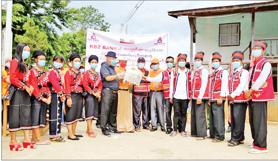
လှူဒါန်းခဲ့ကြသည်။ ထိုမှတစ်ဆင့် ပြည်နယ်ဝန်ကြီးချုပ်နှင့်အဖွဲ့သည် ရှမ်းချယ်ရီပရဟိတကျောင်းသို့ ရောက်ရှိကာ အဲန်၊ လားဟူ၊ အာခါ၊ လွယ်၊ ရှမ်း စသည့် တိုင်းရင်းသားကျောင်းသား

ကျိုင်းတုံ ဇွန် ၁၁ ရှမ်းပြည်နယ်ဝန်ကြီးချုပ် ဒေါက်တာလင်းထွဋ်၊ ရှမ်းပြည်နယ် လွှတ်တော်ဥက္ကဋ္ဌ ဦးစိုင်းလုံးဆိုင်၊ ပြည်နယ်အစိုးရအဖွဲ့ဝင် ဝန်ကြီးများ၊ လွှတ်တော်ကိုယ်စားလှယ်များ၊ ကမ္ဘောဇဘဏ် နာယက ဦးအောင်ကိုဝင်း၊ အကြီးတန်းအုပ်ချုပ်မှုဒါရိုက်တာ ဦးညိုမြင့်နှင့် တာဝန်ရှိသူများ၊ ရှမ်းပြည်နယ် ပြည်သူ့ထု စားနပ်ရိက္ခာထောက်ပံ့ရေးကော်မတီဝင်များ၊ ပရဟိတ အဖွဲ့ဝင်များသည် ယနေ့တွင် ရှမ်းပြည်နယ်(အရှေ့ပိုင်း)ရှိ ရှမ်း၊ လားဟူ၊ လားဟူရီ၊ ဝါ အာခါ၊ လွယ်၊ အဲန် စသည့် တိုင်းရင်းသားများနေထိုင်ရာဒေသများသို့ သွားရောက်၍ အခြေခံပြည်သူများအား ဆန်၊ ဆီ၊ ဆားနှင့် ကုလားပဲများ ပါဝင်သည့် စားနပ်ရိက္ခာများ ထောက်ပံ့ပေးအပ်လှူဒါန်း သည်။