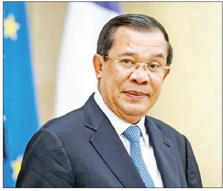
ကမ္ဘောဒီးယားဝန်ကြီးချုပ် ဆမ်ဒက်ဟွန်ဆန်

ကြောင်း ထုတ်ဖော်ပြောကြားခဲ့ကြောင်း သိရသည်။ တစ်ချိန်တည်းမှာပင် အိန္ဒိယဝန်ကြီးချုပ်မိုဒီက ကမ္ဘာ တစ်ဝန်း ကူးစက်ပျံ့နှံ့သွားသည့် ကိုဗစ်-၁၉ ရောဂါ ကူးစက် ပျံ့နှံ့မှုအား ကမ္ဘောဒီးယားအစိုးရအနေဖြင့် အောင်မြင်စွာ ထိန်းချုပ်နိုင်မှုအပေါ် ချီးကျူးဂုဏ်ပြုခဲ့သည်။ ထို့အပြင် ဟွန်ဆန်နှင့် မိုဒီတို့သည် ကိုဗစ်-၁၉ ကမ္ဘာ ကပ်ရောဂါဖြစ်ပွားမှုကာလအတွင်း နှစ်နိုင်ငံစလုံးတွင် သောင်တင်နေကြသော သက်ဆိုင်ရာနိုင်ငံသားများအား နေရပ်ပြန်ပို့နိုင်ရေးအတွက် လိုအပ်ချက်များအား နှစ်နိုင်ငံ အနေဖြင့် အချင်းချင်းပံ့ပိုး ဖြည့်ဆည်းပေးခဲ့မှုအပေါ် အပြန် အလှန်ကျေးဇူးတင်စကားပြောခဲ့ကြကြောင်း သိရသည်။ ကမ္ဘောဒီးယားအစိုးရသည်ကျောင်းသားများအပေါ်အောင် ကမ္ဘောဒီးယားနိုင်ငံသား ၆၀ ခန့်ကို ဇွန် ၁၂ ရက်တွင် စင်းလုံးငှားလေယာဉ်တစ်စင်းဖြင့် အိန္ဒိယနိုင်ငံမှ ကမ္ဘောဒီးယားနိုင်ငံသို့ ခေါ်ဆောင်လာမည်ဖြစ်ကြောင်း သိရသည်။ ထို့အတူ အိန္ဒိယအစိုးရသည်လည်း ကမ္ဘောဒီးယား နိုင်ငံ၌ နေထိုင်ကြသော အိန္ဒိယနိုင်ငံသား ၂၈၀ ခန့်ကို မကြာမီရက်များအတွင်း အိန္ဒိယနိုင်ငံသို့ ပြန်ခေါ်မည်ဖြစ် သည်။