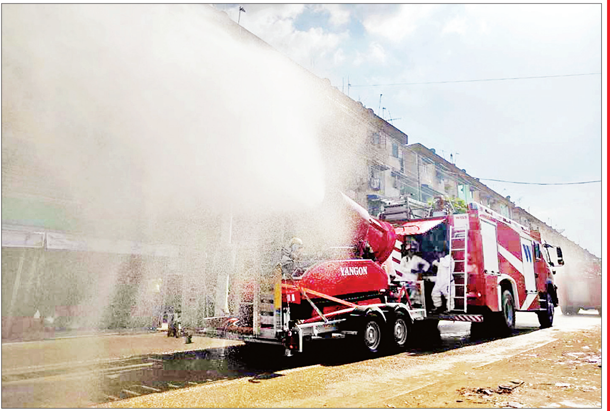
ရန်ကုန်တိုင်းဒေသကြီး သန်လျင်မြို့နယ်၌ ကိုဗစ်-၁၉ ရောဂါ ကာကွယ်ရေး ပိုးသတ်ဆေးဖျန်းစဉ်။