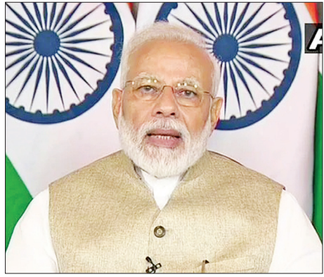
အိန္ဒိယဝန်ကြီးချုပ် နာရန်ဒရာမိုဒီ

သို့သော် ကမ္ဘောဒီးယားနိုင်ငံ၌ နေထိုင်ကြသော အိန္ဒိယ နိုင်ငံသားတချို့သည် ဖေဖော်ဝါရီ ၂၅ ယနေ့ထွက်ခွာသွားပြီး ကျန်တချို့သည် ဇွန် ၁၉ ရက်တွင် ကမ္ဘောဒီးယားမှ အိန္ဒိယ နိုင်ငံသို့ ထွက်ခွာကြမည်ဖြစ်သည်။ ထို့အပြင် နှစ်နိုင်ငံခေါင်းဆောင်တို့သည် ကမ္ဘောဒီးယား