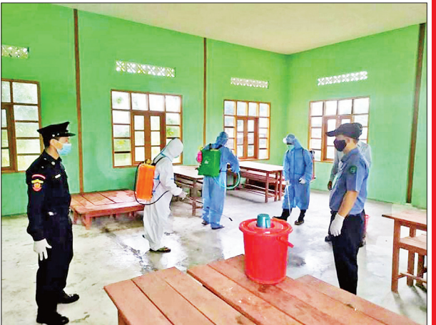
ကချင်ပြည်နယ် မိုးမောက်မြို့နယ် ဒေါ်ဖုန်းယန်မြို့၌ ကိုဗစ်-၁၉ ရောဂါ ကာကွယ်ရေး ပိုးသတ်ဆေးဖျန်းစဉ်။