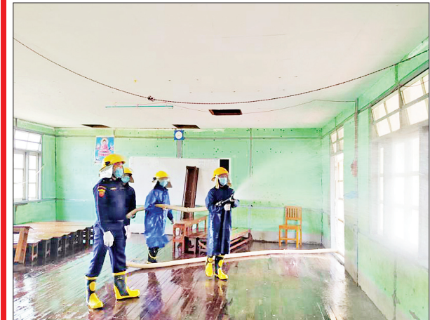
မကွေးတိုင်းဒေသကြီး သရက်မြို့နယ် ရေနံမကျေးရွာအခြေခံပညာအထက်တန်းကျောင်း၌ ကိုဗစ်-၁၉ ရောဂါ ကာကွယ်ရေး ပိုးသတ်ဆေးဖျန်းစဉ်။