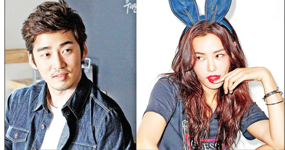
အေးပြည့် - စုစည်းသည်

တောင်ကိုရီးယားရဲ့ ကျော်ကြားတဲ့ ကြယ်ပွင့်စုံတွဲတစ်တွဲဖြစ်တဲ့ မင်းသား ယွန်းကေဆန်းနဲ့ မင်းသမီး ဟန်နီလီတို့ဟာ လတ်တလောမှာတော့ ခုနစ်နှစ်ကြာ ဖြတ်သန်းလာခဲ့တဲ့ ဆက်ဆံရေးတစ်ခုကို အဆုံးသတ်ကာ လမ်းခွဲလိုက်ပြီဖြစ်ကြောင်း အော့ကေပေါ့ဒေါ့ကွန်းရဲ့ ရေးသားဖော်ပြချက်တွေအရ သိရပါတယ်။