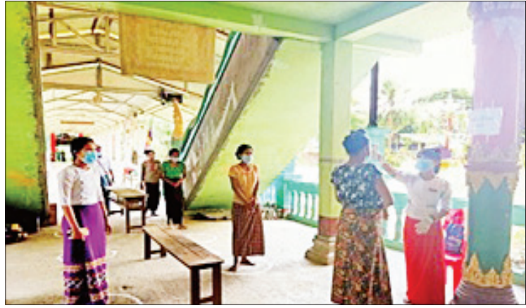
ဘုန်းတော်ကြီးကျောင်းအတွင်း၌ ကျန်းမာရေးဝန်ထမ်းများက ငွေထုတ်ချေးယူမည့် ကျေးရွာသူ ကျေးရွာသားများအား ခြောက်ပေအကွာစီခြား၍ အပူချိန်တိုင်းပေးစဉ်။

ကျေးလက်ဒေသဖွံ့ဖြိုးတိုးတက်ရေး ဦးစီးဌာနမှ ကိုဗစ်-၁၉ ရောဂါဖြစ်ပွားနေသည့် အခက်ခဲဆုံး ကာလအတွင်း ကျေးရွာ အရောက် မြို့နယ် ၂၃၃ မြို့နယ်၊ ကျေးရွာ ၁၆၅၆ ရွာရှိ ကျေးလက်နေပြည်သူ ၁၇၃၀၀ ဦးအား အတိုးနှုန်း ပြား ၅၀ နှုန်းဖြင့် ထုတ် ချေးပေးနိုင်ခဲ့သဖြင့် ကျေးလက်နေပြည်သူ များ မိသားစုဝင်ငွေတိုးလုပ်ငန်းများ ဆောင် ရွက်နိုင်ပြီဖြစ်ကြောင်း တင်ပြလိုက်ရ ပါသည်။ ။