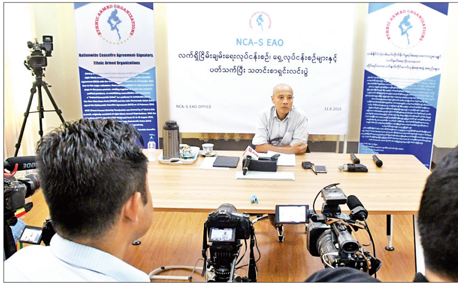
အပိုင်းသုံးပိုင်းနဲ့ ချုပ်ဆို

(၈) ကြိမ်မြောက် တစ်နိုင်ငံလုံး ပစ်ခတ်တိုက်ခိုက်မှုရပ်စဲရေး သဘောတူစာချုပ် အကောင်အထည်ဖော်မှုဆိုင်ရာ ညှိနှိုင်းအစည်းအဝေး (JICM) ကို ဇန်နဝါရီ ၈ ရက်က နေပြည်တော်တွင် ကျင်းပခဲ့ပြီး ပြည်ထောင်စုငြိမ်းချမ်းရေးညီလာခံ-(၂၁)ရာစုပင်လုံ စတုတ္ထအစည်းအဝေးတွင် ပြည်ထောင်စုသဘောတူစာချုပ် အစိတ်အပိုင်း(၃)ကို အပိုင်းသုံးပိုင်းဖြင့် ချုပ်ဆိုသွားရန် သဘောတူညီခဲ့ကြသည်။