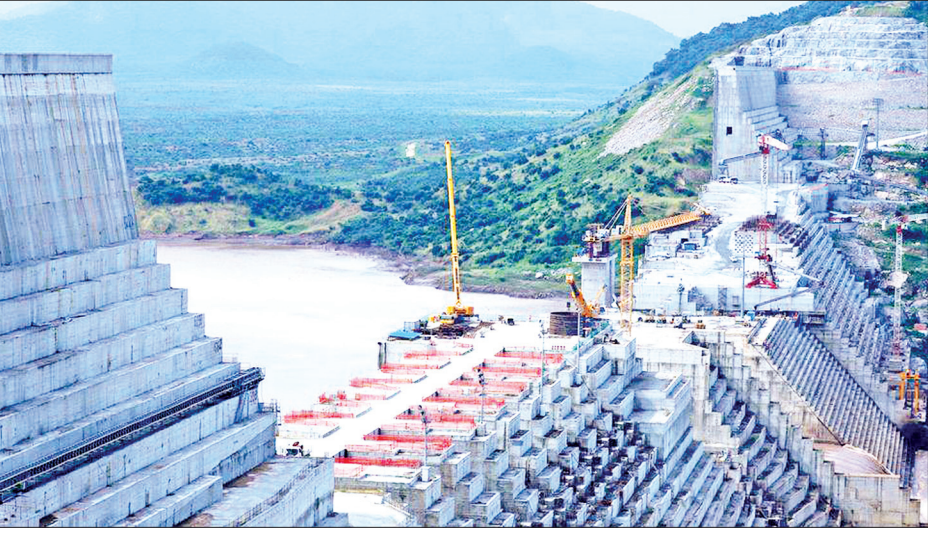
နိုင်းမြစ်တွင် တည်ဆောက်ထားသည့် အီသီယိုးပီးယားနိုင်ငံ၏ ရေကာတာကို တွေ့ရစဉ်။

နိုင်ငံရေးအရ အဖြေရှာပြီး အဆုံးသတ် ရန် အီဂျစ်အစိုးရ၏ ကြိုးပမ်း လုပ်ဆောင်မှုအပေါ် ထရမ်က ကြိုဆို ကြောင်း သိရသည်။ လစ်ဗျားနိုင်ငံ ခေါင်းဆောင် ဟောင်း မွမ်မာကဒါဒါအား ရာထူးမှ ဖြုတ်ချခံရပြီးနောက် ပြည်တွင်းစစ်ပွဲ များ ဆက်လက်ဖြစ်ပွားလျက်ရှိကြောင်း သိရသည်။ ကိုးကား - ဆင်ဟွာ ဘာသာပြန် - ဂျေတီ