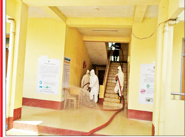
ချင်းပြည်နယ် ဟားခါးမြို့၌ ကိုဗစ်-၁၉ ရောဂါ ကာကွယ်ရေး ပိုးသတ်ဆေးဖျန်းစဉ်။

နေပြည်တော် ဇွန် ၁၁ သက်ဆိုင်ရာတိုင်းစစ်ဌာနချုပ်အသီးသီးမှ တပ်မတော်သားများ၊ မီးသတ်တပ်ဖွဲ့ဝင်များ၊ ဌာန၊ အဖွဲ့အစည်းများပူးပေါင်း၍ ကိုဗစ်-၁၉ ရောဂါ ကာကွယ်ထိန်းချုပ်နိုင်ရေးအတွက် ဇွန် ၆ ရက်က ပိုးသတ်ဆေးဖျန်းခြင်း လုပ်ငန်းများကို နေပြည်တော်၊ တိုင်းဒေသကြီး၊ ပြည်နယ်များမှ မြို့နယ် ၄၇ မြို့နယ်ရှိ နေရာ ၁၀၁ နေရာတို့တွင် မီးသတ်ယာဉ်များ၊ မီးသတ်ပစ္စည်း ကိရိယာများဖြင့် ဆောင်ရွက်ခဲ့ရာ ပိုးသတ်ဆေးရည် ၁၁၂ ဂါလန်နှင့် ပိုးသတ်ဆေးမှုန့် ၁၃ ကီလိုဂရမ် သုံးစွဲခဲ့ပြီး ပိုးသတ်ဆေးဖျန်းခြင်းလုပ်ငန်းများကို တာဝန်ရှိသူများက လိုက်လံကြည့်ရှုအားပေးခဲ့ကြောင်း သိရသည်။ သတင်းစဉ်