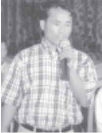
သိန်းမြူချက်လုပ်ရေလုပ်ငန်း များတွင် သံချောင်း ပါဝင်ပတ် သက်မှုမှန်စွာလုပ်ဆောင် ပြီးနီးနီး (ခ) ဦးလေး မြေကြားစဉ်။ (သတင်းစဉ်)

ထို့အတူပဲ ၎င်းတို့နဲ့ ပူးပေါင်းကြံစည်လုပ်ဆောင်နေကြတဲ့ NCGUB၊ NCUB၊ FTUB၊ DAB၊ NDF၊ NDD၊ VBSW စတဲ့ အဖွဲ့တွေ၊ ၎င်းတို့နဲ့ ပတ်သက်ဆက်စပ်နေတဲ့ NLDပါတီဝင်တွေ၊ DPNSပါတီဝင်တွေ၊ ဗမာ့သမ္မတတော်လှန်ရေးတပ်မတော် ၎င်းတို့ကို ကူညီထောက်ပံ့ပြီး အားပေးအားမြှောက် ပြုလုပ်နေကြတဲ့ ပြည်ပနိုင်ငံများမှာ NGO အမည်ခံအဖွဲ့တွေ၊ ပြည်ပဆရာကြီး တွေအားလုံးဟာ အရွယ်ကိုလိုသူ နိုင်ငံရေးသမား၊ အသွားစေခိုင်းသူ ကိုလိုနီ နယ်ချဲ့လက်သစ်၊ လေးပစ်သူ နယ်ချဲ့အားကိုးပုဆိန်ရိုးဆိုသလို အပေါင်းပါ အကြမ်းဖက်အဖျက်သမား (Terrorist)များသာဖြစ်နေတာကို သုံးသပ်တွေ့ရှိ ရမှာဖြစ်ကြောင်း ရှင်းလင်းပြောကြားရင်း နိဂုံးချုပ်အပ်ပါတယ်။