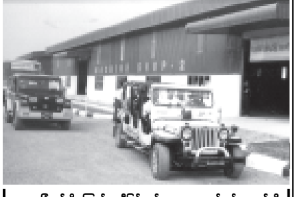
ခြံစည်းရိုး ကြက်ဆူဆီဖြင့် ဂုဏ်ကားများ မောင်းနှင်နေသည်ကို ဤသို့တွေ့ရသည်။ (တော်ပုံမှတ်တမ်း-မြန်မာ့အလင်း)

မိနစ်၄၀ကြာကြိုလျှင် ကြက်ဆူဆီ ၅ပုလင်းရရှိသည်။ ဘေးတိုက် လွန်သွား ကြိတ်စက်ကိုသုံးကောင်းကောင်း မော်တာဖြင့်ကြိုလျှင် ကြက်ဆူဆီ ၆ ပုလင်း ရရှိသည်။ ထို့ကြောင့် စီးပွားဖြစ်ဝင်ငွေတိုးပို့ရန်အတွက် ခြံစည်းရိုးကြက်ဆူပင် များများစိုက် ကြက်ဆူဆီ များများထုတ်လုပ်ကြရန် ဖြစ်ပေသည်။