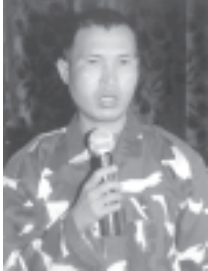
SSA (တောင်ပိုင်း) တပ်မဟာ (၂၄) မှ တပ်စွဲမှူး အဆင့်ရှိ နိုင်းထူး မြေကြားစဉ်။ (သတင်းစဉ်)

ဟိုမှာ ကျွန်တော်တို့ နေရာတလဲ ငြိမ်းငြိမ်း ချမ်းချမ်းတော့ မရှိဘူး ပေါ့။ ခေါင်းဆောင်ပိုင်းတွေကတော့ ကြီးပွားနေပြီးတော့ လက်အောက် ငယ်သားတွေက ဒုက္ခ အမျိုးမျိုးခင်းရဲ ခံခဲ့ကြရတော့ပေါ့နော်။ တကယ် တမ်းကျတော့ ဒီ ABSDF ဟာ အကြမ်းဖက်အဖွဲ့ အညံ့အညံ့တစ်ဖွဲ့ပါ။ နောက်ခံလို တောထဲတွေကို ပြောတာ ကတော့ ဒီမိုကရေစီလိုချင်လို့ သွား ကြတယ်။ (၁၀)နှစ်သာ ကျော်လာ တယ်။ ဘာတစ်ခုမှလည်း ဖြစ်လာတာ မရှိပါဘူး။