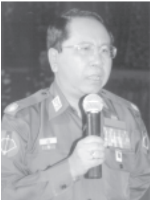
နိုင်ငံတော် အေးချမ်းသာယာရေးနှင့် ဖွံ့ဖြိုးရေးကောင်စီ၏ သတင်းထုတ်ပြန်ရေးကော်မတီ ဥက္ကဋ္ဌ မြန်ကြားရေး ဝန်ကြီးဌာန ဝန်ကြီး ဦးစံကိုင်ဖနှင့် သတင်းစာရှင်းလင်းပွဲ (၂/၂၀၀၆) တွင် မေးမြန်းချက်များကို ပြန်လည် ရှင်းလင်း ပြောကြားစဉ်။ (သတင်းစဉ်)

နိုင်ငံတော်အေးချမ်းသာယာရေးနှင့် ဖွံ့ဖြိုးရေးကောင်စီ၏ သတင်းထုတ်ပြန်ရေးကော်မတီက သတင်းစာရှင်းလင်းပွဲ (၂/၂၀၀၆)ကို ဖေဖော်ဝါရီ ၂၁ ရက် နံနက် ၉ နာရီ ၄၅ မိနစ်တွင် လားရှိုး၊ ဖြိုတော်ခန်းမ၌ ကျင်းပရာ ပြည်ထောင်စုမြန်မာနိုင်ငံတော်ဆိုင်ရာ နိုင်ငံခြားသံရုံးများမှ သံတမန်များ၊ သံရုံးယာယီ တာဝန်ခံများ၊ ကုလသမဂ္ဂလက်အောက်ခံအဖွဲ့အစည်းများမှ ဌာနကော်မတီဝင်များ၊ သတင်းနှင့်စာနယ်ဇင်းဆိုင်ရာ တာဝန်ရှိပုဂ္ဂိုလ်များ၊ မြန်မာနိုင်ငံနိုင်ငံခြား သတင်းထောက်များအသင်းဥက္ကဋ္ဌ ဦးစံကိုင်ဖနှင့် အသင်းဝင်သတင်းထောက်များ၊ ပြည်တွင်း ကုန်သွယ်ရေးစဉ်းကမ်းမှုများ တာဝန်ရှိသူများ တက်ရောက်၍ သတင်းရှုထောင့်သည်-