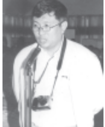
ယူစီယူရိုင်းအဖွဲ့မှ ဦးကိုကို မေးမြန်းစဉ်။ (သတင်းစဉ်)