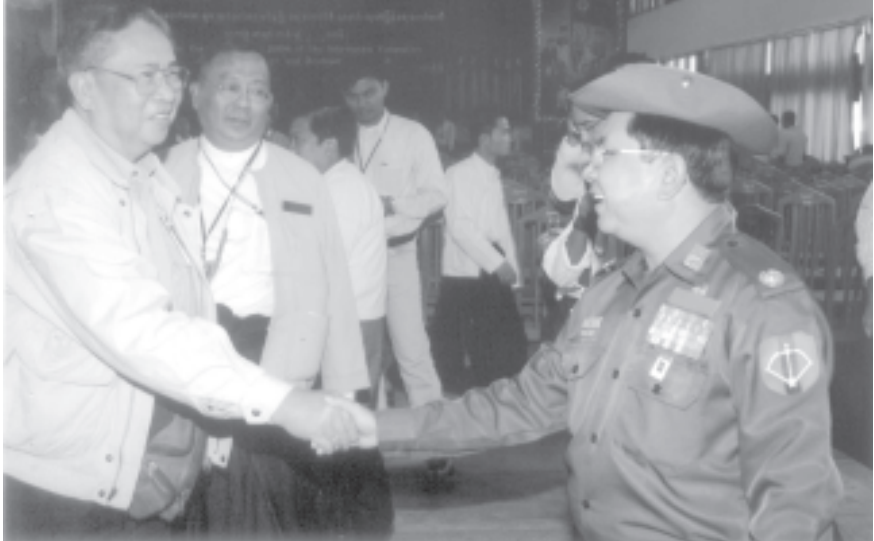
နိုင်ငံတော်အေးချမ်းသာယာရေးနှင့်ဖွံ့ဖြိုးရေးကောင်စီ၏ သတင်းထုတ်ပြန်ရေးကော်မတီဥက္ကဋ္ဌ ပြန်ကြားရေးဝန်ကြီးဌာနဝန်ကြီး ပိုလ်မျိုးချုပ် ကျော်ဆန်း ပြည်တွင်းပြည်ပ သတင်းဌာနများနှင့် စာနယ်ဇင်းများမှ သတင်းတာဝန်ခံများအား ရင်းရင်းနှီးနှီးနှုတ်ဆက်စဉ်။

အဆိုပါ သတင်းစာရှင်းလင်းပွဲသို့ နိုင်ငံတော် အေးချမ်းသာယာရေးနှင့် ဖွံ့ဖြိုးရေးကောင်စီ၏ သတင်းထုတ်ပြန်ရေးကော်မတီဥက္ကဋ္ဌ ပြန်ကြားရေးဝန်ကြီးဌာန ဝန်ကြီး ပိုလ်မျိုးချုပ်ကျော်ဆန်း၊ ကာကွယ်ရေးဝန်ကြီးဌာနမှ ပိုလ်ချုပ်ခင်အောင်မြင့်၊ နိုင်ငံခြားရေးဝန်ကြီးဌာန ဒုတိယဝန်ကြီးဦးကျော်သူ၊ အရှေ့မြောက်တိုင်းစစ်ဌာနချုပ် ဒုတိယတိုင်းမှူး ပိုလ်မျိုးချုပ်လှမြင့်၊ တပ်မတော်အရာရှိကြီးများ၊ ပြည်ထောင်စုမြန်မာနိုင်ငံတော်ဆိုင်ရာ သံတမန်အဖွဲ့နာယက ဖိလစ်ပိုင်သမ္မတနိုင်ငံသံအမတ်ကြီး H.E.Mme Phoebe A.Gomez နှင့် ရန်ကုန်မြို့ရှိ နိုင်ငံခြားသံရုံးများမှ သံအမတ်ကြီးများ၊ သံရုံးယာယီတာဝန်ခံများ၊ ကုလသမဂ္ဂရလက်အောက်ခံ အဖွဲ့အစည်းများမှ ဌာနကော်မတီဝင်များ၊ ရှမ်းပြည်နယ်(မြောက်ပိုင်း) ပြည်နယ်အဆင့် ဌာနဆိုင်ရာများ၊ ပြန်ကြားရေးဝန်ကြီးဌာန သတင်းနှင့်စာနယ်ဇင်းလုပ်ငန်း ညွှန်ကြားရေးမှူး(သတင်း) ဦးဝင်းတင်နှင့် သတင်းနှင့် ပြန်ကြားရေးဆိုင်ရာ တာဝန်ရှိသူများ၊ မြန်မာနိုင်ငံ နိုင်ငံခြား သတင်းထောက်များအသင်းဥက္ကဋ္ဌ ဦးစံကိုင်းဖနှင့် အဖွဲ့ဝင် သတင်းထောက်များ၊ မြန်မာနိုင်ငံ စာပေနှင့်စာနယ်ဇင်းအဖွဲ့ (ဖဟို)အလုပ်အမှုဆောင် ဦးအုန်းမောင်(မြင်းမူ-မောင်နိုင်မိုး)နှင့် ပြည်တွင်း ဂျာနယ်မဂ္ဂဇင်းများမှ အယ်ဒီတာချုပ်များနှင့် သတင်းတာဝန်ခံများ၊ ဌာနဆိုင်ရာ တာဝန်ရှိသူများ၊ ရပ်မိရပ်ဖများနှင့် အထူးဖိတ်ကြားထားသူများ တက်ရောက်ကြသည်။ ထို့အတူ လက်နက်နှင့် ငြိမ်းချမ်းရေးအပြီးအပိုင်လဲလှယ်ပြီးဖြစ်သည့် ဦးအိုက်မိုး၊ ဦးကန်နု၊ ဦးခွန်ဆေ၊ ဦးဂုဏ်ခေး၊ ဦးခိုင်ကျ၊ ဦးခွန်စစ်ညို၊ ဦးလောက်လျန်းနှင့် ဥပဒေဘောင်အတွင်း ဝင်ရောက်လာခဲ့ပြီးဖြစ်သည့်