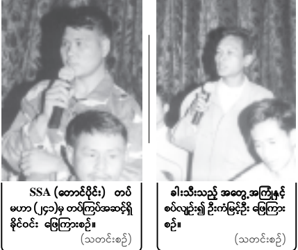
SSA (ကောင်းပိုင်း) တပ် မဟာ (၂၄)မှ တပ်ကြပ်အဆင့်ရှိ နိုင်ငံစား ဖြေကြားစဉ်။ (သတင်းစဉ်)